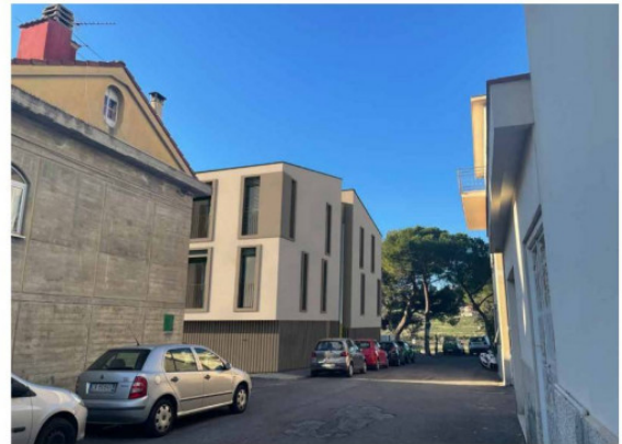
RENDER vista dell'esterno